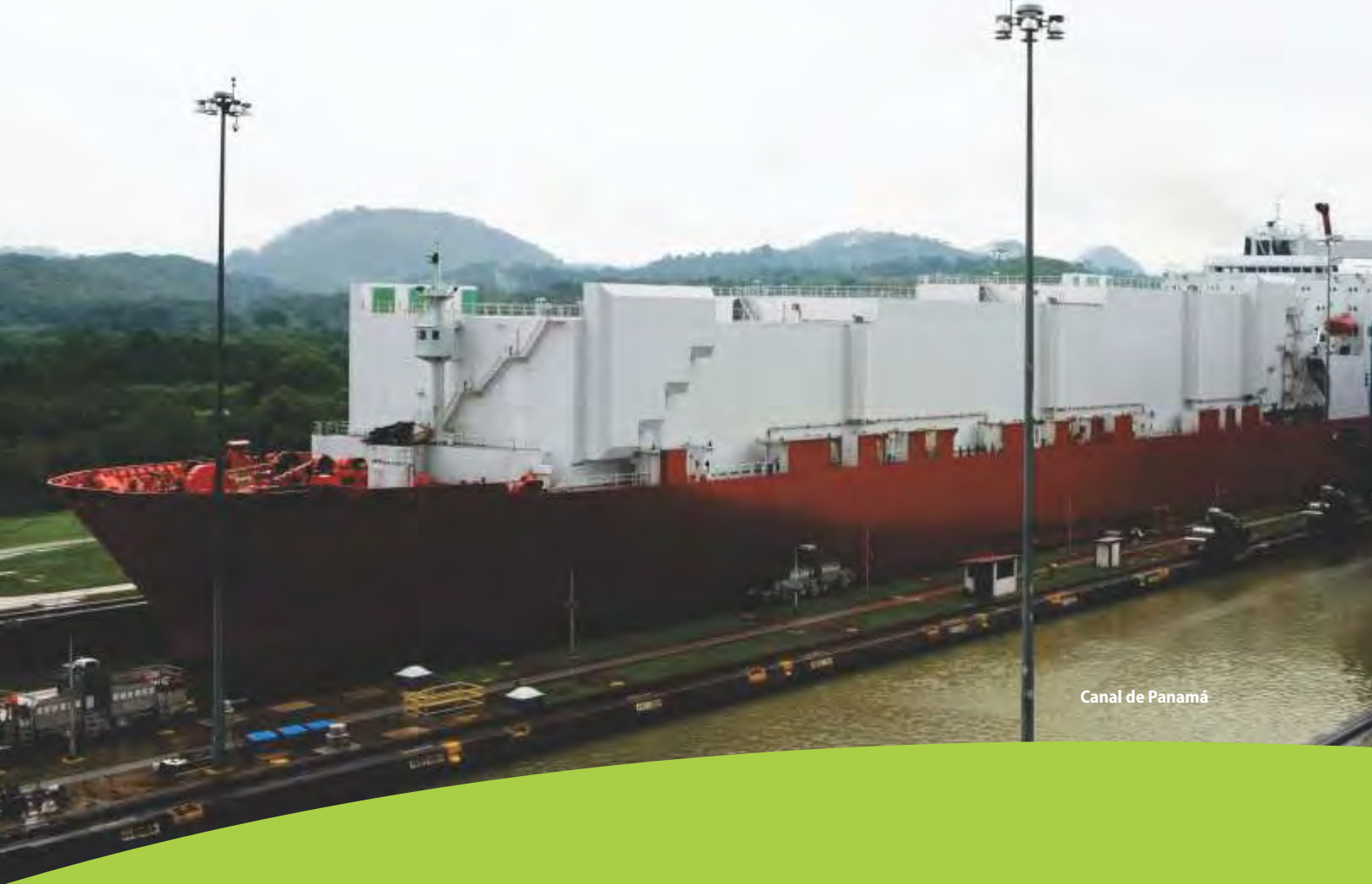
Canal de Panamá